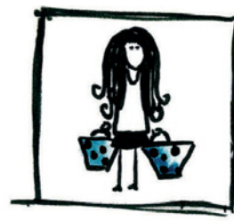
4 Die Frau trägt die/- Taschen.

In anderen Grammatikbüchern nennt man das Objekt auch Ergänzung .