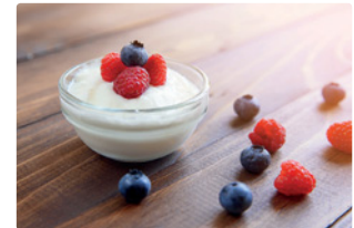
der Joghurt, das Obst