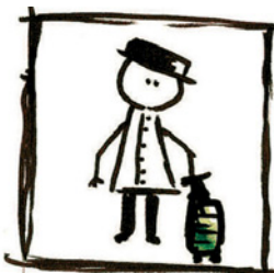
2 Der Mann zieht den/einen Koffer.