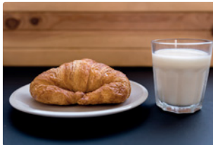
das Croissant, die Milch