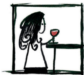
1 Die Frau trinkt das/ein Glas Wein.