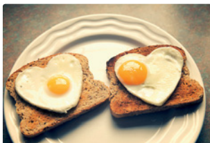
der Toast, das Ei