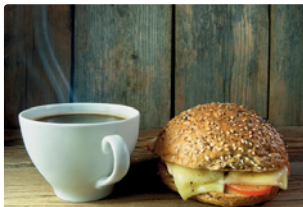
der Kaffee, das Käsebrötchen