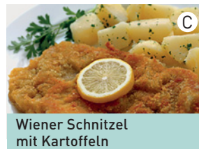
Wiener Schnitzel mit Kartoffeln