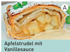
Apfelstrudel mit Vanillesauce