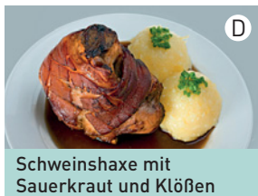
Schweinshaxe mit Sauerkraut und Klößen