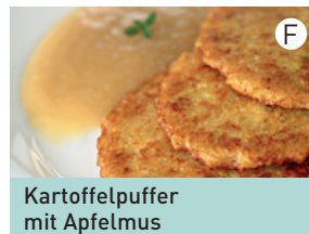
Kartoffelpuffer mit Apfelmus