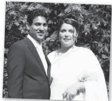
Le mariage de ma sœur