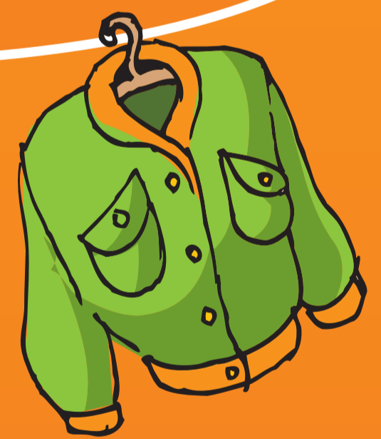
● Jacke (-n)