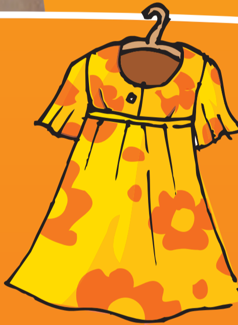
● Kleid (-er)