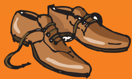
● Schuh (-e)