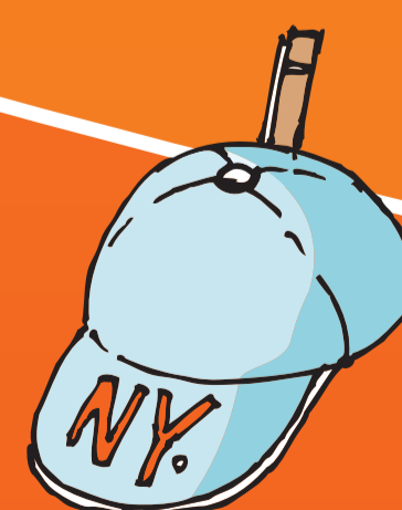
● Kappe (-n)