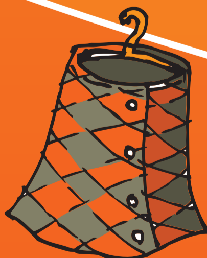
● Rock (≠e)