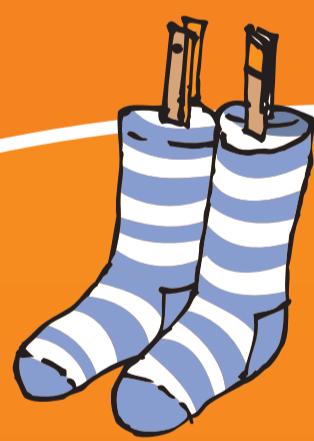
● Socke (-n)