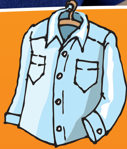
● Hemd (-en)