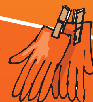
● Handschuh (-e)