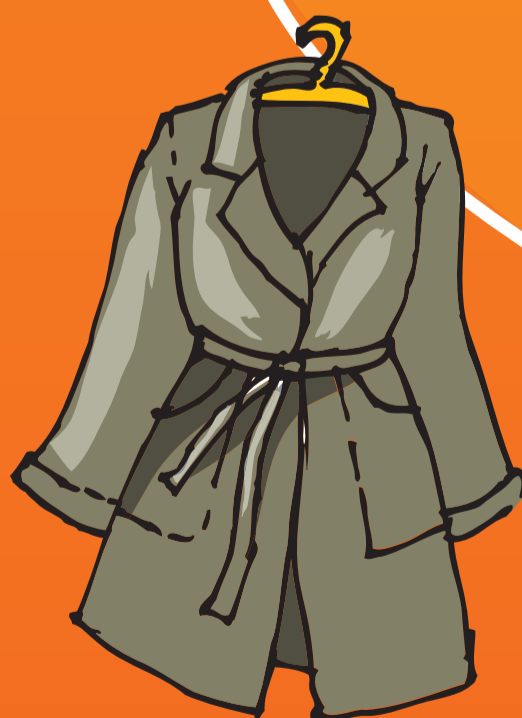
● Mantel (≠)