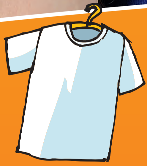
● T-Shirt (-s)