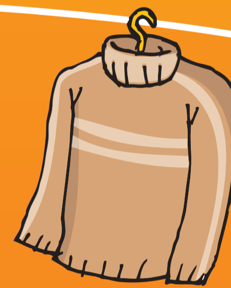
● Pullover (-)