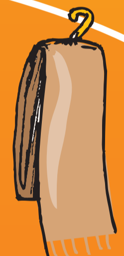
● Schal (-s)