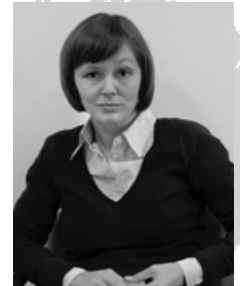
5. levantar la ceja

inseguridad en sí mismo actitud a la defensiva