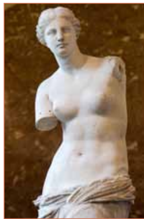
Venus von Milo