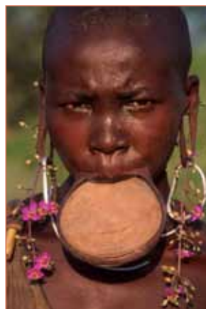
Mursi-Frau mit Lippenteller