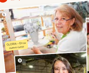
GLORIA - En su nuevo curso

hablar de cambios y continuidad • expresar la duración de una acción • hablar de hábitos en el presente • expresar intenciones y deseos • decir cómo se hace o se aprende algo