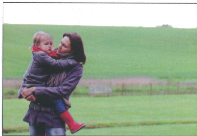
Situation 1 : Vous habitez en ville, vous habitez à la campagne.