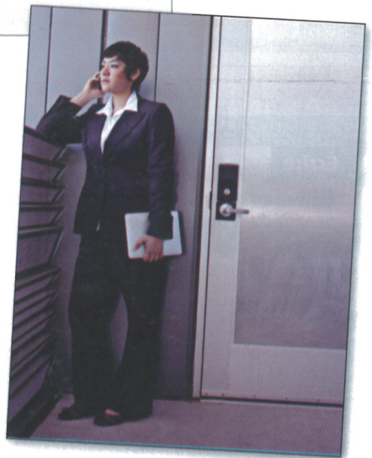
Situation 2 : Vous habitez à la campagne, vous habitez en ville.