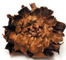
carciofi alla giudia