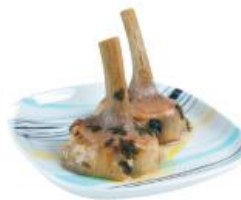
carciofi alla romana

1. togliere le foglie esterne; 2. mettere in una ciotola con acqua e limone; 3. farli asciugare; 4. sbattere i carciofi a testa in giù su un ripiano; 5. friggere; 6. scolare, 7. condire; 8. friggere.